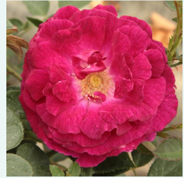
Rosa Trompeter von Säckingen

valkoinen - historiallinen - perpetual hybridi ruusu 180-250 cm hienovaraisen tuoksuinen ruusu - aprikoosiarominen C. Brown