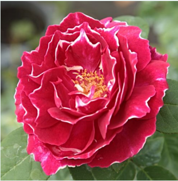
Rosa Baron Girod de l'Ain

punainen - valkoinen - historiallinen - perpetual hybridi ruusu 100-150 cm voimakkaan tuoksuinen ruusu - mangoarominen Reverchon