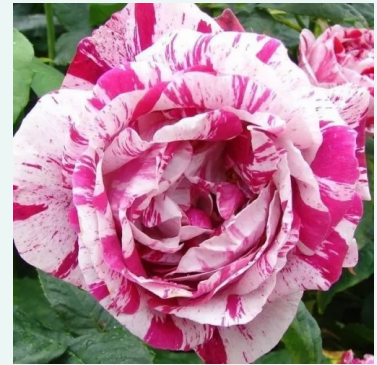
Rosa Ferdinand Pichard