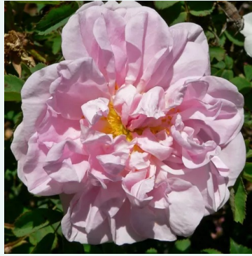
Rosa Stanwell Perpetual