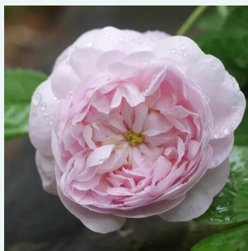
Rosa Duchesse De Montebello

liila - vaaleanpunainen - historiallinen - damaskonruusu 120-240 cm voimakkaan tuoksuinen ruusu - hedelmäinen arominen Jean Laffay