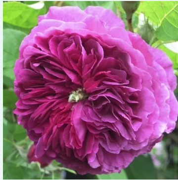
Rosa Erinnerung an Brod