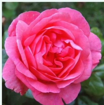
Rosa Frau Dr. Schrickler

valkoinen - historiallinen - vanha puutarharuusu 120-150 cm keskivahvasti tuoksuva ruusu - sitruunan arominen Morlet