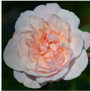
Rosa Irène Watts

liila - vaaleanpunainen - historiallinen - portland ruusu 90-120 cm voimakkaan tuoksuinen ruusu - vanilja-arominen Jean Laffay