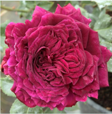
Rosa Empereur du Maroc