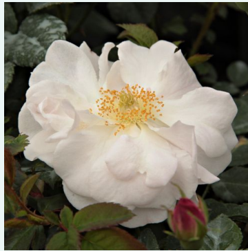
Rosa Félicité et Perpétue

vaaleanpunainen - historiallinen - centifolia ruusu 90-185 cm voimakkaan tuoksuinen ruusu - vanilja-arominen Edward A. Bunyard