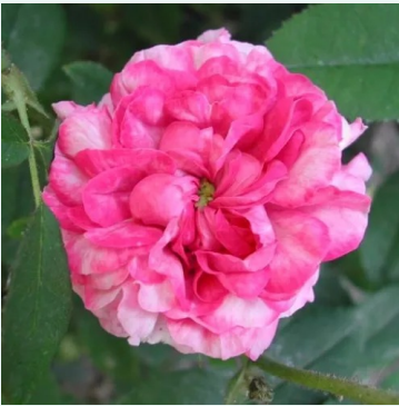
Rosa Ambroise Paré

vaaleanpunainen - historiallinen - rambler, köynnösrusu 200-600 cm hienovaraisen tuoksuinen ruusu - hedelmäinen arominen Brent C. Dickerson