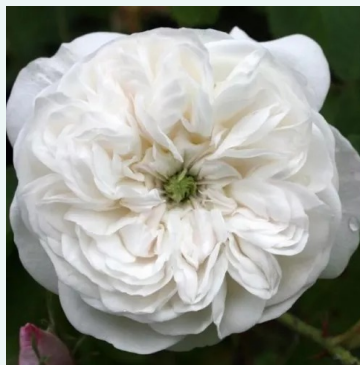
Rosa Madame Hardy