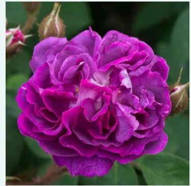
Rosa William Lobb